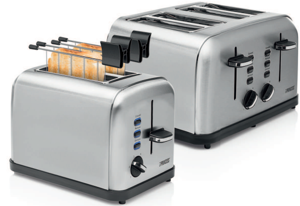
Toaster Steel Style 2 / Toaster Steel Style 4 01.142354.01.001 / 01.142355.01.001

PARTS DESCRIPTION / ONDERDELENBESCHRIJVING / DESCRIPTION DES PIÈCES / TEILEBESCHREIBUNG / DESCRIPCIÓN DE LAS PIEZAS / DESCRIÇÃO DOS COMPONENTES / DESCRIZIONE DELLE PARTI / BESKRIVNING AV DELAR / OPIS CZĘŚCI / POPIS SOUČÁSTÍ / POPIS SUČASTI / ОПИСАНИЕ ЗАПЧАСТИ