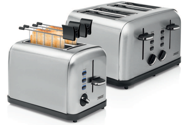
Toaster Steel Style 2 / Toaster Steel Style 4 01.142354.01.001 / 01.142355.01.001

PARTS DESCRIPTION / ONDERDELENBESCHRIJVING / DESCRIPTION DES PIÈCES / TELEBESCHREIBUNG / DESCRIPCIÓN DE LAS PIEZAS / DESCRIÇÃO DOS COMPONENTES / DESCRIZIONE DELLE PARTI / BESKRIVNING AV DELAR / OPIS CZĘŚCI / POPIS SOUČÁSTÍ / POPIS SOUČASTI / ОПИСАНИЕ ЗАПЧАСТИ